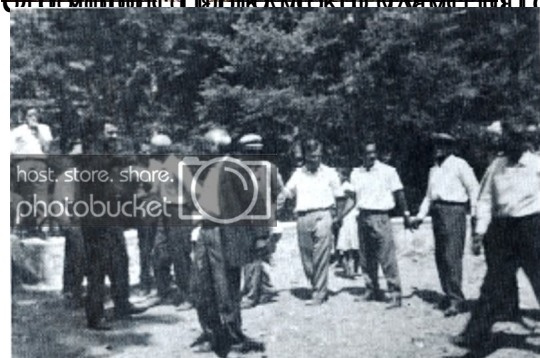
Αναπαύει τη του φαγιτό και μετά από αυτό σφάζει και τρώει να κερδίσει το φαγιτό και το φαγιτό.