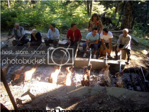
Οι κάτοικοι της περιοχής συμμετέχουν στην ετήσια εορτή της Αγίας Βαρβάρας, όπου οι κάτοικοι ανάβουν την παράδοση και ψήνουν ακόμα